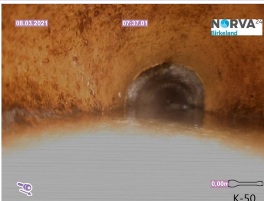
Spillvann_Septiktank_Påkobling kommunal kum_20210308_130431.jpg