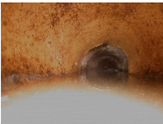
Spillvann_Septiktank_Påkobling kommunal kum_20210308_130433.jpg