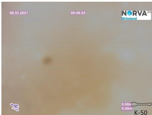
Spillvann_Septiktank_Påkobling kommunal kum_20210308_130441.jpg

Dato for inspeksjonen 08.03.2021 Inspeksjonsnummer 1 Inspeksjonsretning Medstrøms