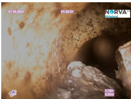
Spillvann_Inn til hus_Septik tank_20210507_144359.jpg