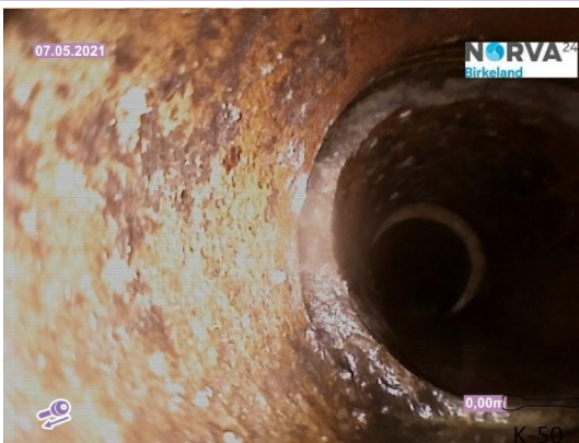
Spillvann_Inn til hus_Septik tank_20210507_144216.jpg