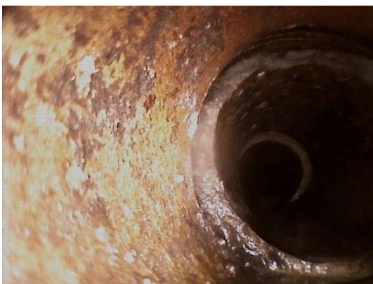
Spillvann_Inn til hus_Septik tank_20210507_144220.jpg