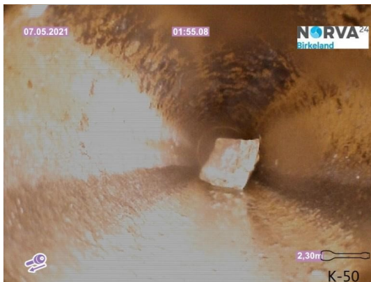
Spillvann_Inn til hus_Septik tank_20210507_144901.jpg

Dato for inspeksjonen 07.05.2021 Inspeksjonsnummer 1 Inspeksjonsretning Motstrøms