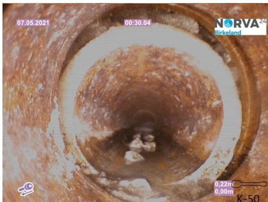
Spillvann_Inn til hus_Septik tank_20210507_144253.jpg

Dato for inspeksjonen 07.05.2021 Inspeksjonsnummer 1 Inspeksjonsretning Motstrøms