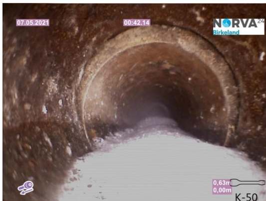
Spillvann_Inn til hus_Septik tank_20210507_144313.jpg