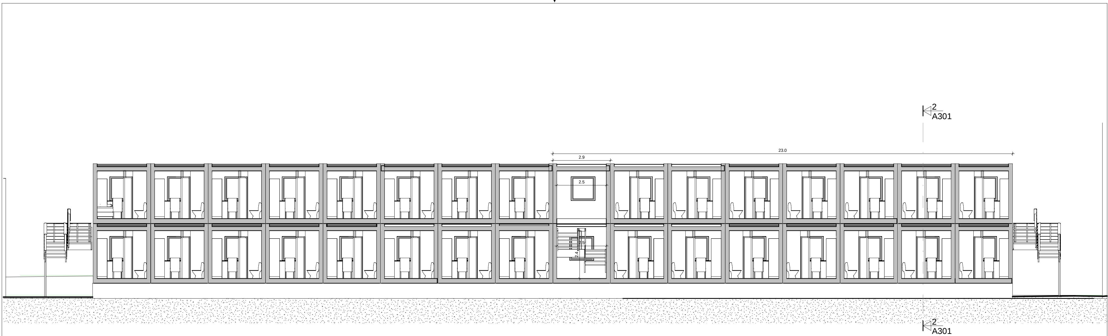
Snitt B1-B1 1:100