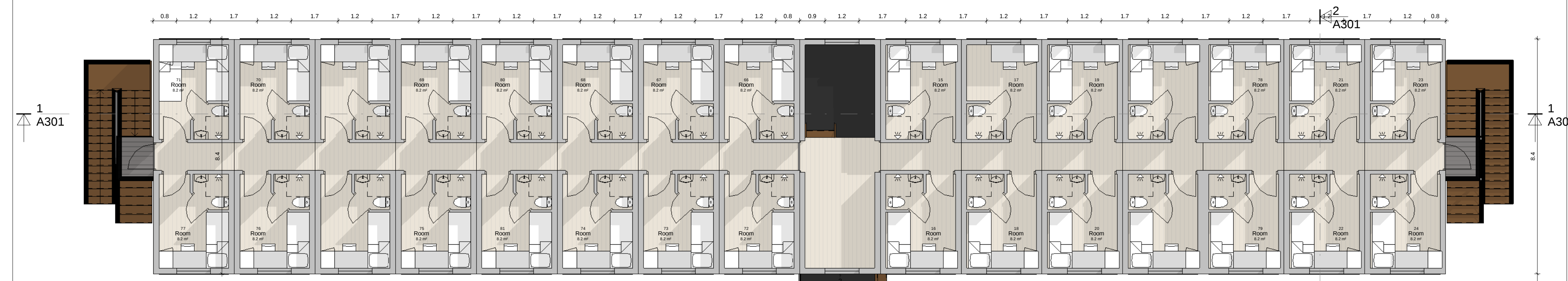
Et. 2 1:100