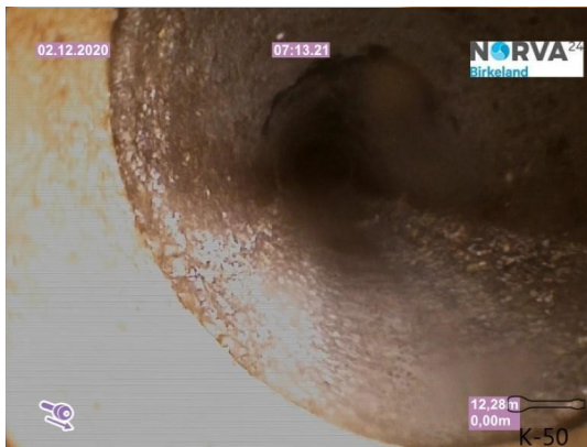
Spillvann_Sluk i dusj 1etg_Påkobling_20201202_105030.jpg