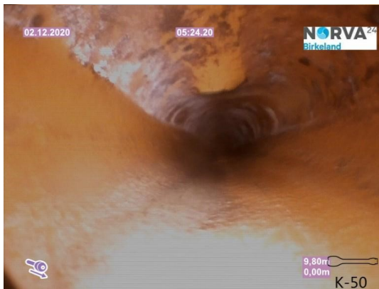
Spillvann_Sluk i dusj 1etg_Påkobling_20201202_104751.jpg