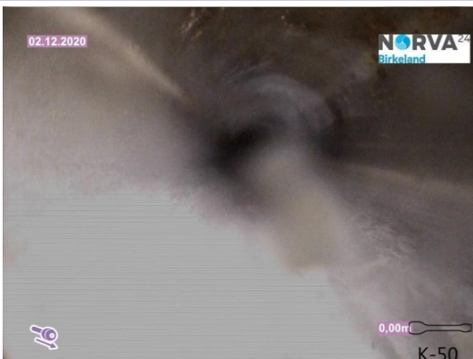
Spillvann_Sluk i dusj 1etg_Påkobling_20201202_104115.jpg