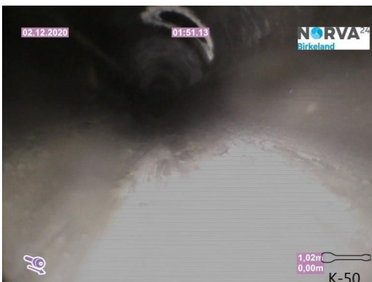
Spillvann_Sluk i dusj 1etg_Påkobling_20201202_104327.jpg