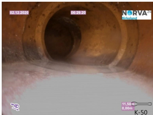
Spillvann_Sluk i dusj 1etg_Påkobling_20201202_104923.jpg