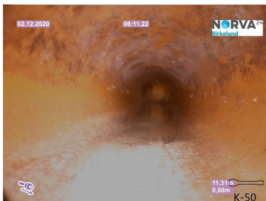
Spillvann_Sluk i dusj 1etg_Påkobling_20201202_104859.jpg