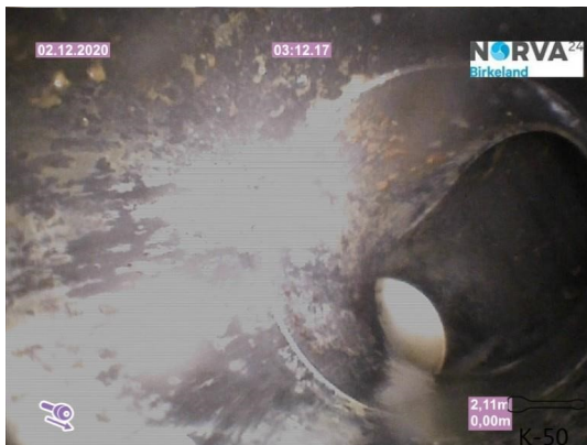
Spillvann_Sluk i dusj 1etg_Påkobling_20201202_104457.jpg