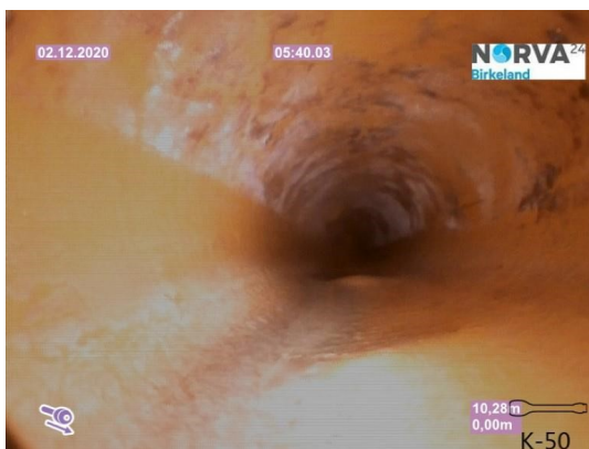
Spillvann_Sluk i dusj 1etg_Påkobling_20201202_104814.jpg