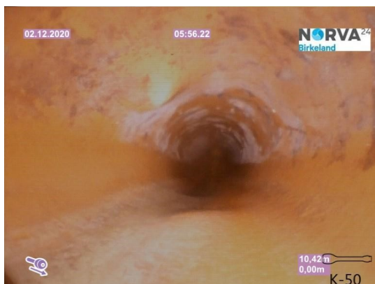
Spillvann_Sluk i dusj 1etg_Påkobling_20201202_104837.jpg

Dato for inspeksjonen 02.12.2020 Inspeksjonsnummer 1 Inspeksjonsretning Medstrøms