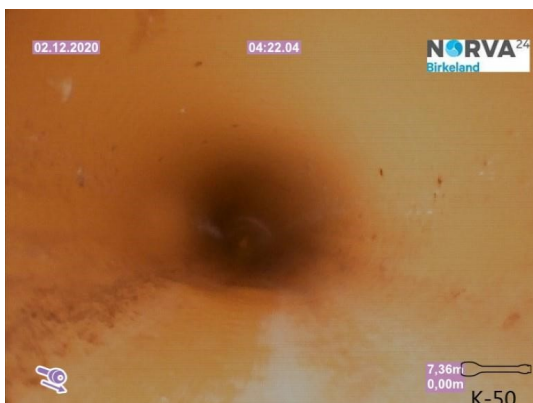
Spillvann_Sluk i dusj 1etg_Påkobling_20201202_104633.jpg