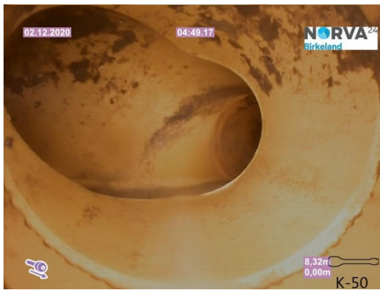
Spillvann_Sluk i dusj 1etg_Påkobling_20201202_104708.jpg