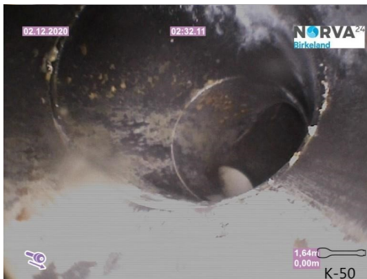
Spillvann_Sluk i dusj 1etg_Påkobling_20201202_104413.jpg

Dato for inspeksjonen 02.12.2020 Inspeksjonsnummer 1 Inspeksjonsretning Medstrøms