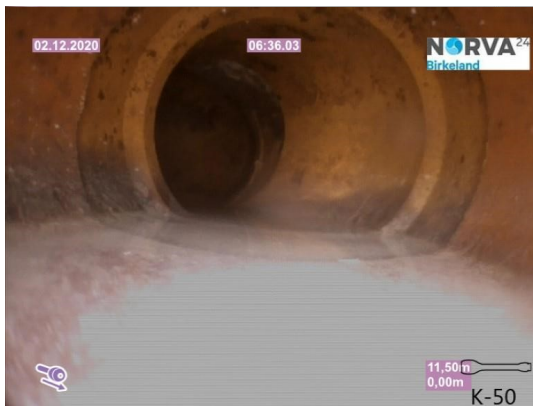
Spillvann_Sluk i dusj 1etg_Påkobling_20201202_104942.jpg

Dato for inspeksjonen 02.12.2020 Inspeksjonsnummer 1 Inspeksjonsretning Medstrøms