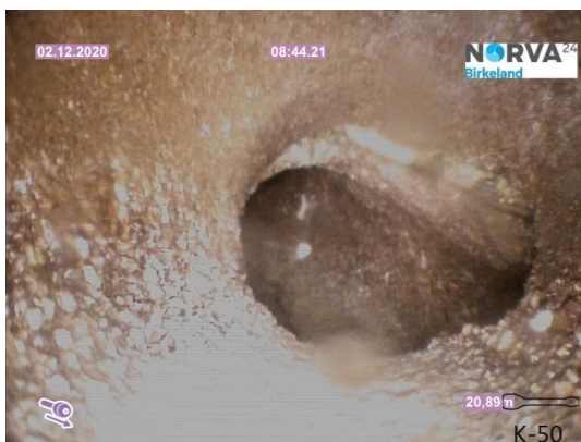
Spillvann_Sluk i dusj 1etg_Påkobling_20201202_105221.jpg