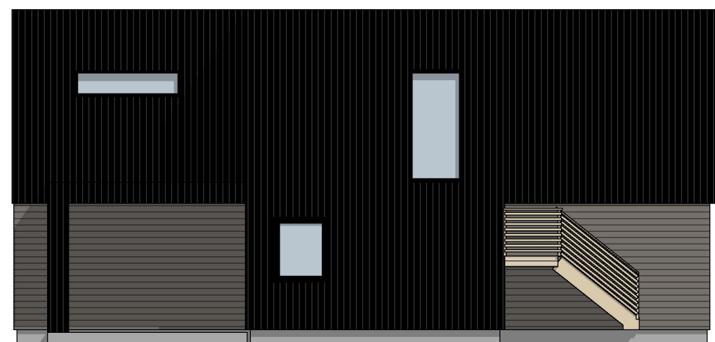
1:100 Fasade Nord