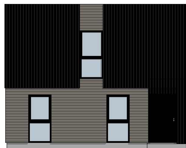
1:100 Fasade Øst