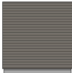
1:100 Fasade Nord