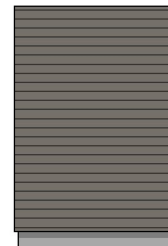
1:100 Fasade Vest