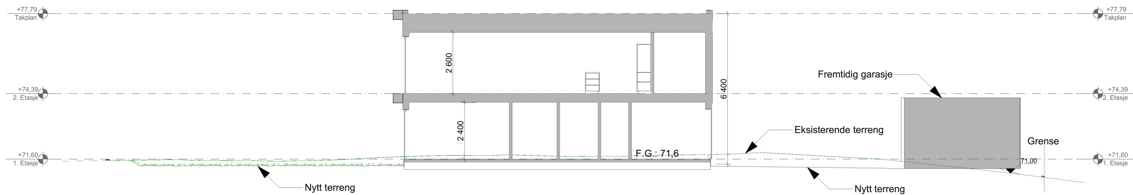
1:100 Snitt B