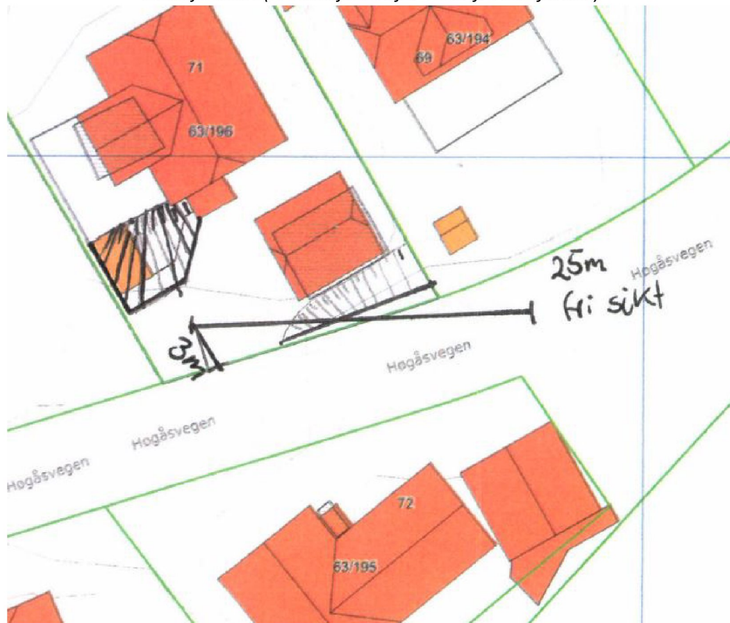
Situasjonskart (NB-ikke justert for vilkår fra Samferdsel)