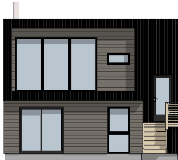
1:100 Fasade Vest