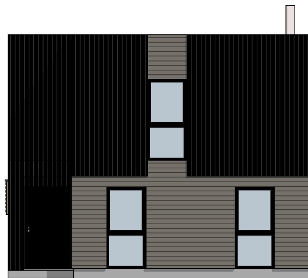
1:100 Fasade Øst