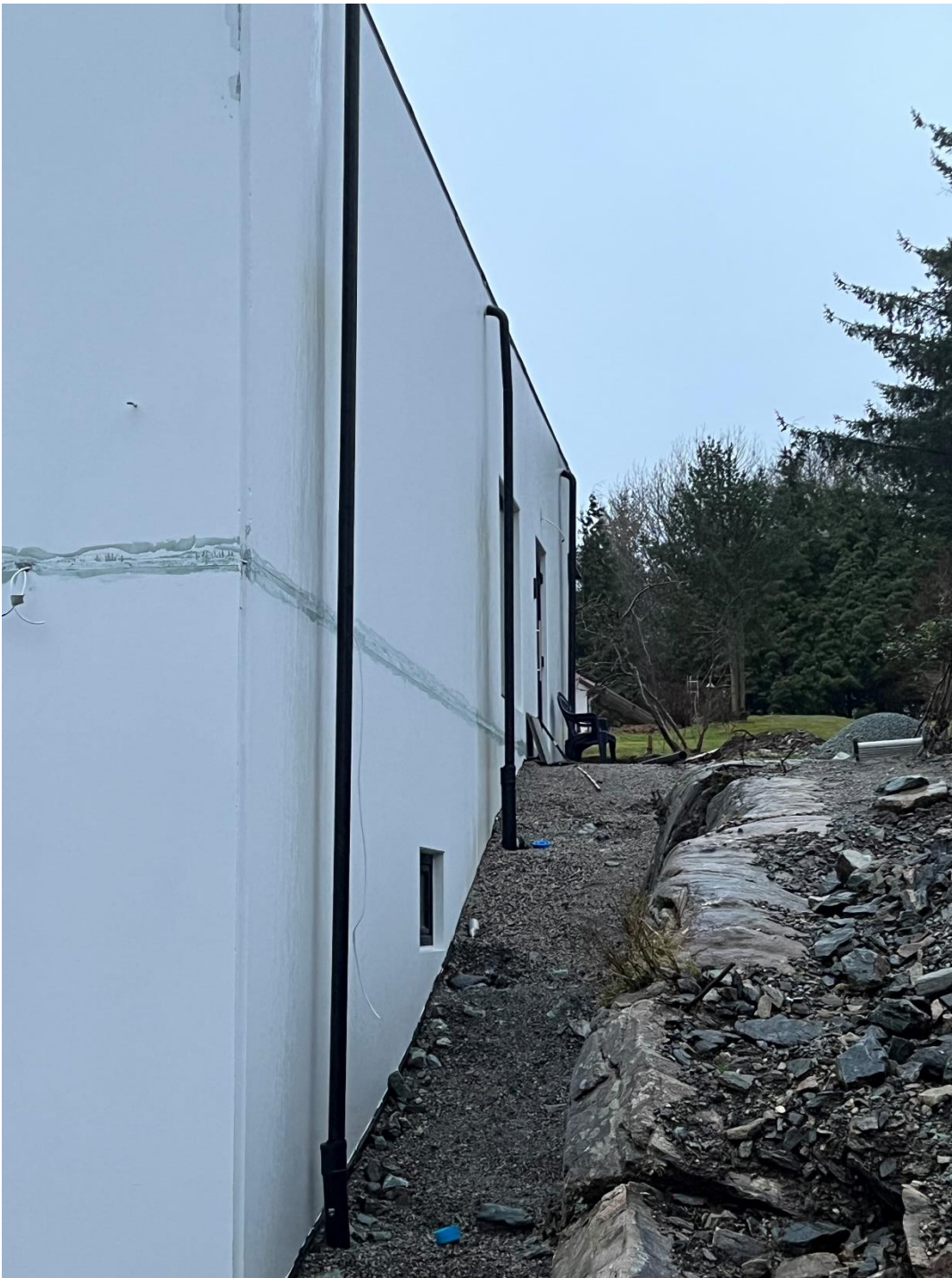
Vedlegg 4 – Bilde av takrenne nedløp tilkoblet overvann.