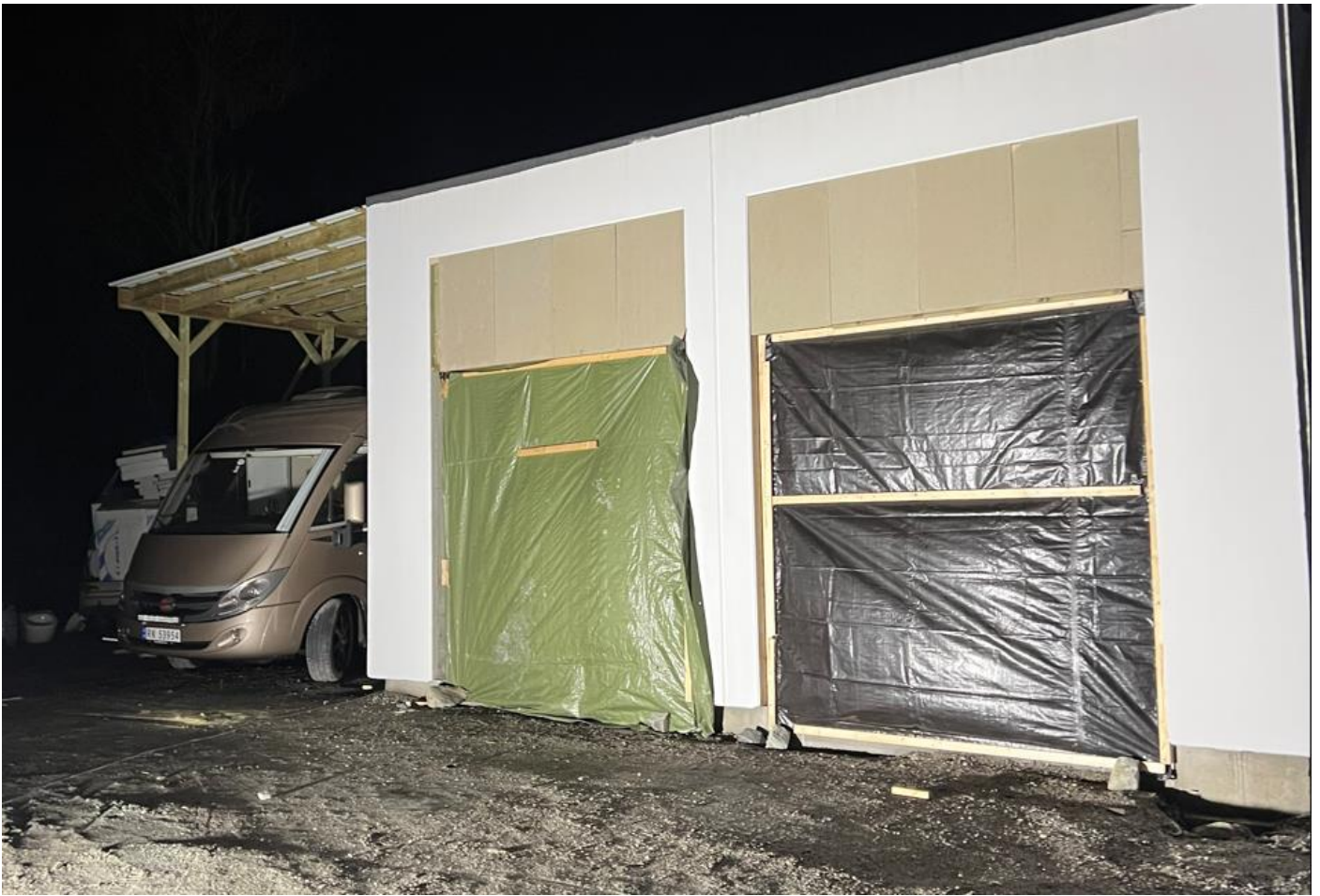
Portåpning 250x250 som på byggetegning