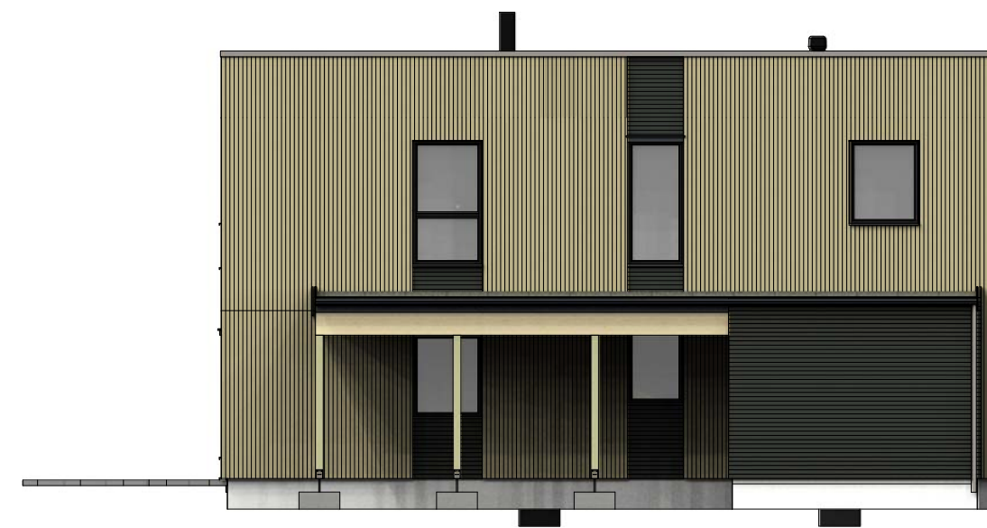
Fasade mot sør-øst