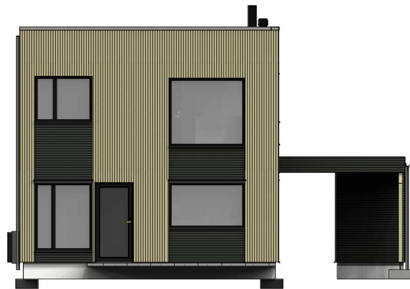
Fasade mot sør-vest