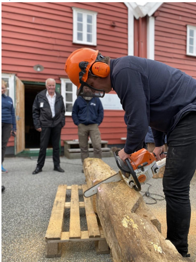
P1 – Skiveprøve av stav