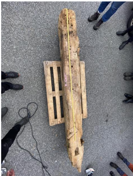
P1 – Staven i full lengde (vidvinkelbilde)