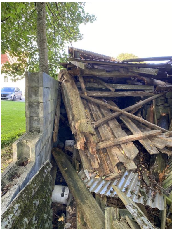
Fig. 1. Nedfalt løe på Syregarden i Syre, Gnr. 38/21, Karmøy kommune, Rogaland.