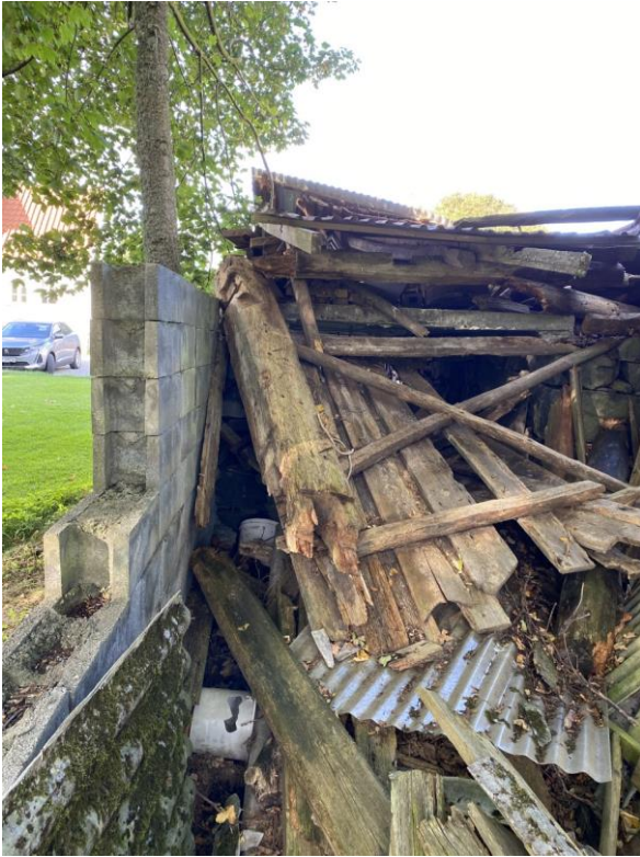
Fig. 1. Nedfalt løe på Syregarden i Syre, Gnr. 38/21, Karmøy kommune, Rogaland.