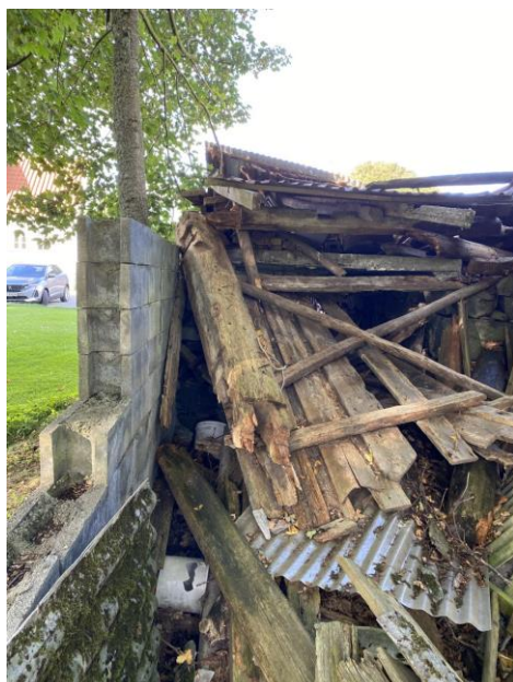
P1 – Staven før den ble hentet ut a ruinen