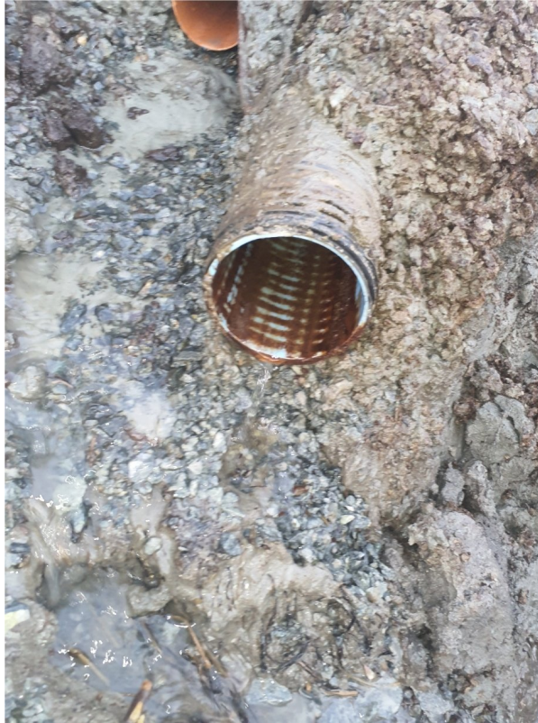
SI 0,00m Fra åpen grøft mot vestre karmøyveg 240 ov