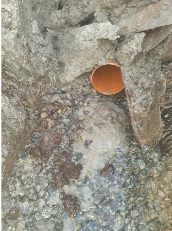
SI 0,00m Fra åpen grøft mot vestre karmøyveg 240 sp