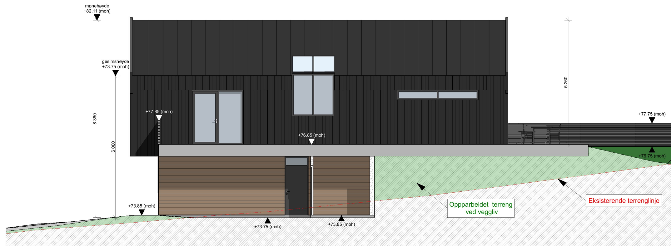
1:100 Fasade Vest