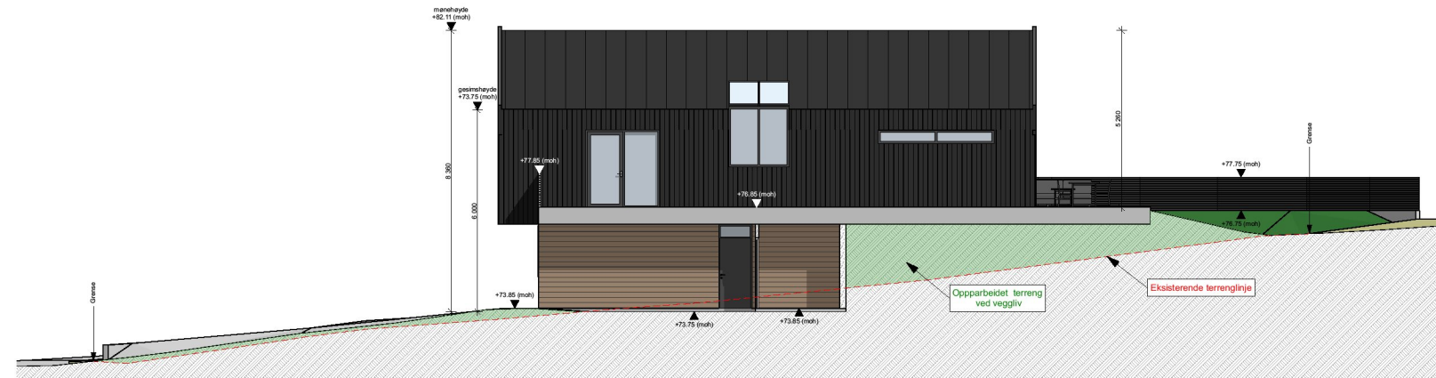
1:200 Fasade Vest