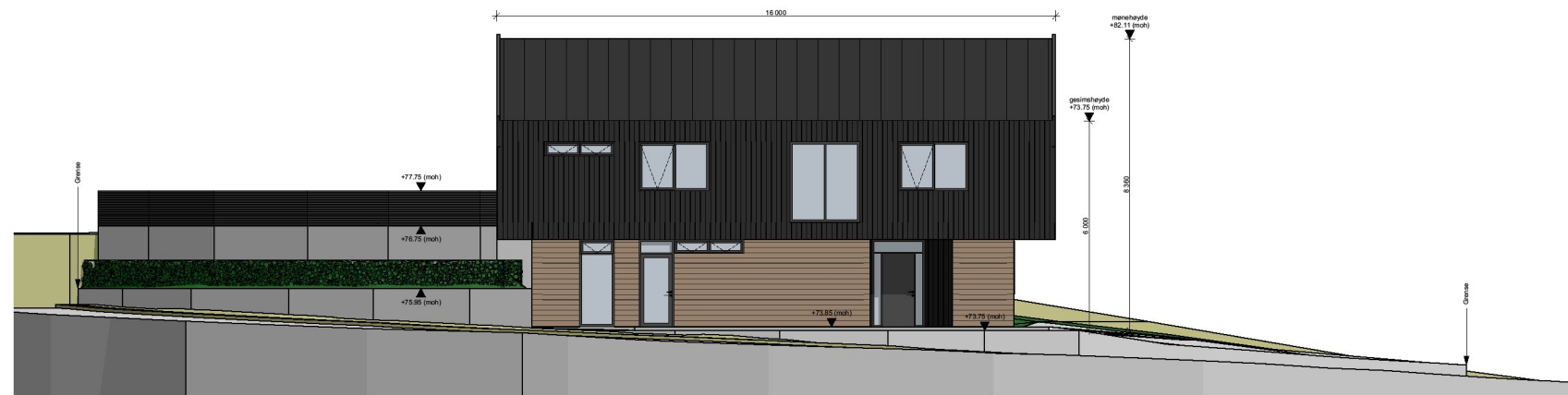
1:200 Fasade Øst