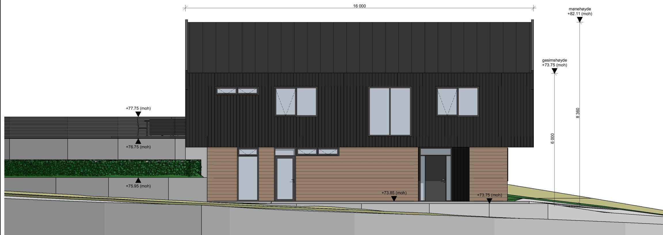
1:100 Fasade Øst