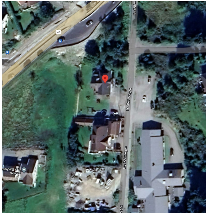
Foto fra Fra åpen grøft mot hus fredheimvegen 21