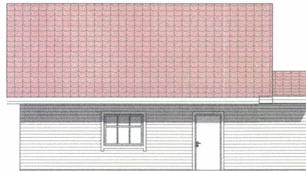
Fasade Nord/Øst 1:100