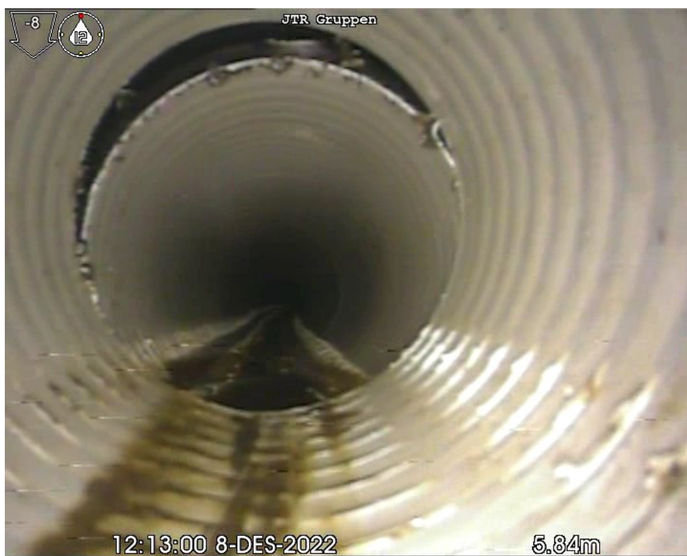
FS 5,80m Forskjøvet skjøt, Gradering 2, Retning: Langsgående, KI 12-12