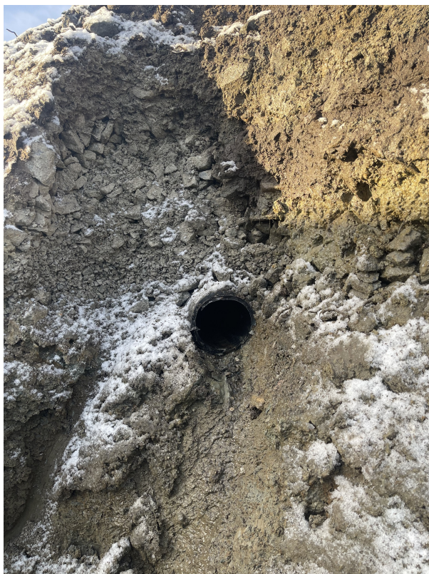
SI 0,00m Fra rør i grøft mot vestre karmøyveg 221