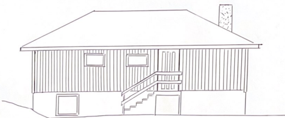
FASADE MOT: NORD-ÖST