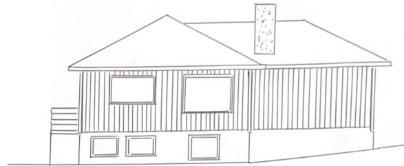
FASADE MOT: NORD-VEST