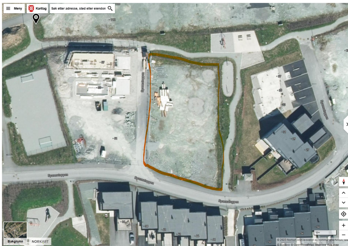
Figur 1 Klipp fra Fonnakart

Utbygge kjøpte en ferdig planert tomt som er inn målt til å ligge på Kote 68,00 moh. Omsøkte boliger skal etableres på denne planerte tomten med boliger plassert på den høyden som situasjonskartet setter. Dette medfører at tomt i snitt løptes ca 40 cm for å tilpasses høyden på veien som vil bli tilkomsten til boligene. Det skal ikke bygges noen murer i forbindelse med prosjekter. Terreng arronderes med skråninger ned til eksisterende terreng. Prosjektet vil ikke medføre terrengforandringer utover noen små justeringer som legges naturlig inn som skråninger.