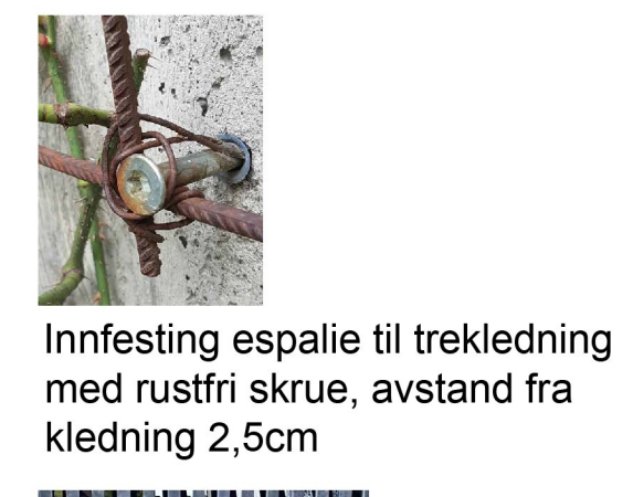
Innfesting espalie til trekledning med rustfri skruer, avstand fra kledning 2,5cm