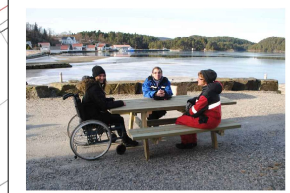
Benkebord med plass til rullestol