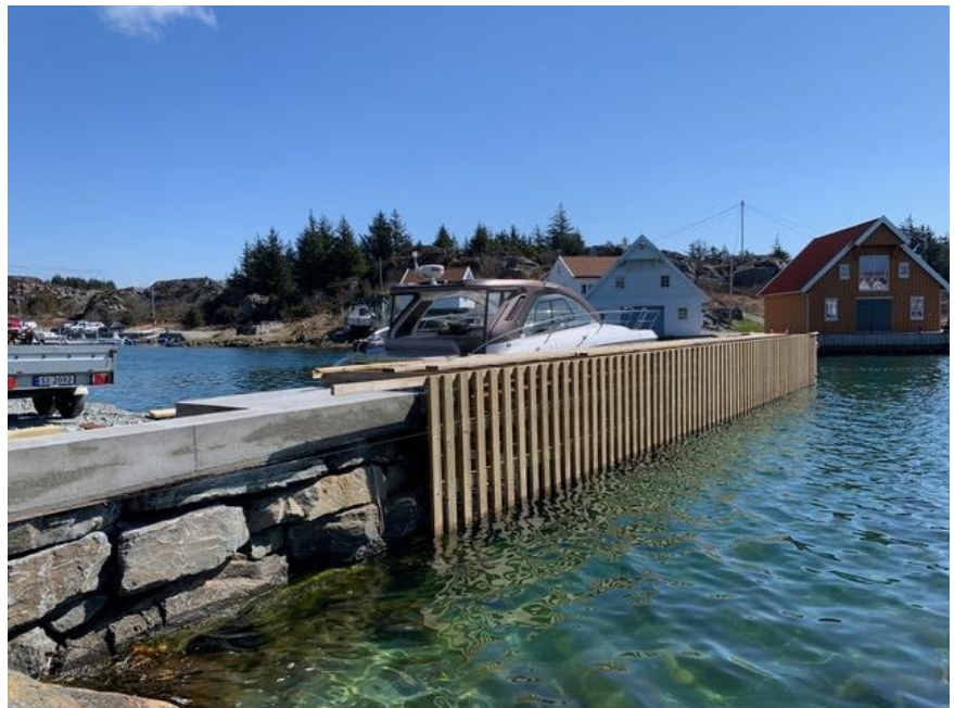
1 - foto av piren, kilde: Syre båtforening

Vår kommentar: Utført tiltak er kai med utførelse som beskrevet i siste avsnitt over. Kaien er bygget for å absorbere bølger og strøm, bryggeskjeppet er 2x6 toms plank og montert med 15 cm mellomrom for å slippe inn/gjennom bølger. Analysen sier ikke noe om at retningen er avgjørende for bølgepåvirkning. Retningen er fortsatt ca 90 grader på kaien langs land.