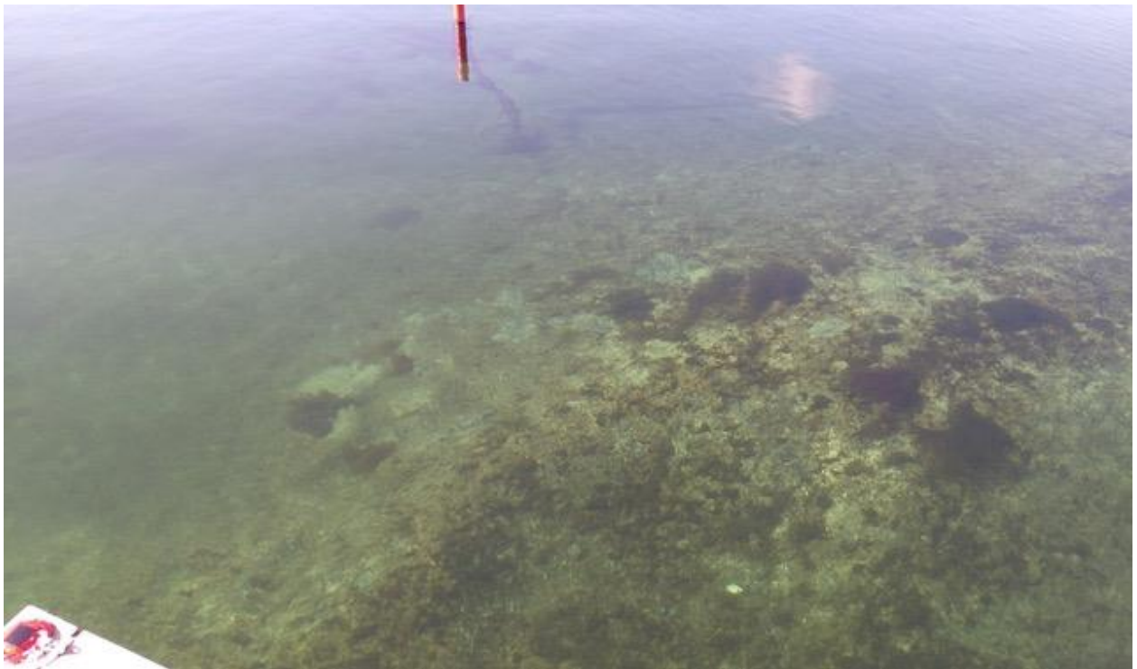
3 - Foto av sjøbunn mellom ny kai/pir og rød stake