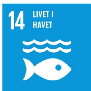
LIVET I HAVET