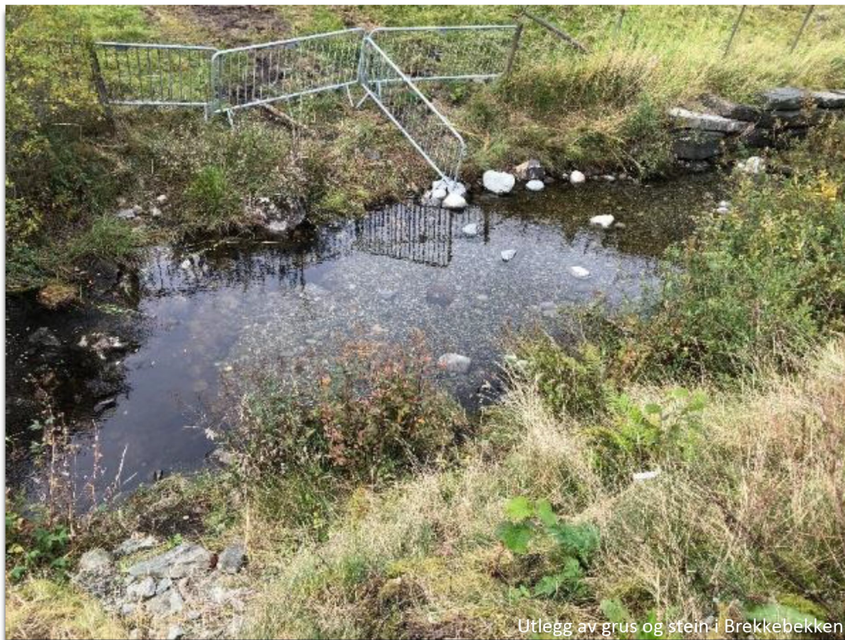
Utløgg av grus og stein i Brekkebekken