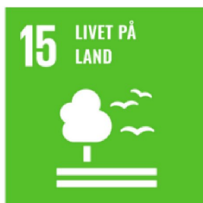
LIVET PÅ LAND