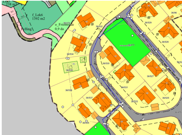
Etter endring med byggegrense