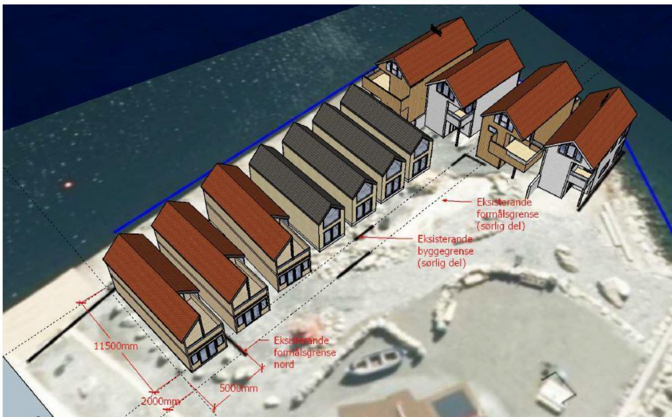
Fig. 3: Illustrasjon av planlagt utbygging av formåla FB3 og FB4 med frittliggende fritidsbebyggelse. Dei fire bygningane øvst til høgre er allereie bygde.

Oppdragsgiver: Porsholmen Utbygging AS Oppdragsnr.: 52300656 Dokumentnr. R01