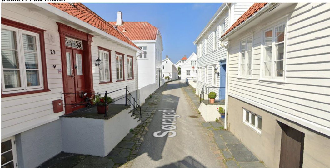
Figur 7 Utsnitt fra Søragedå.

Samlet sett vil belastningen med det visuelle med nye avfallsstasjoner være en mindre ulempe enn fordelene som oppnås. Brannvern er sentralt i hensynet bak bestemmelsene om bevaring av kulturmiljøet i Skudeneshavn med tett trehusbebyggelse med trange gater, og fjerning av private søppeldunker bidrar positivt i så måte.