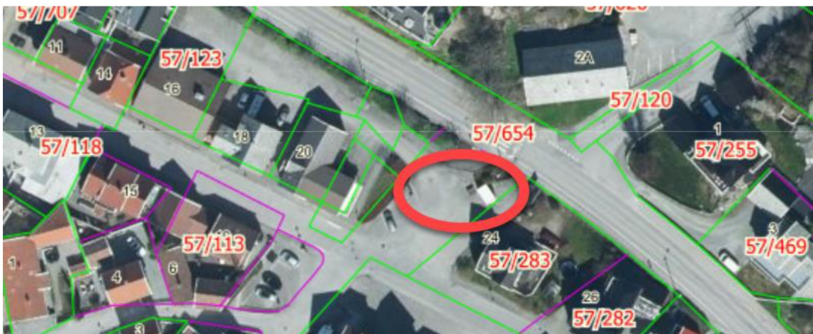
Figur 1 Markert område viser tiltenkt plass for avfallsstasjoner.

Hensikten bak bestemmelsen er å ivareta hensynet til sikker adkomst til området eiendommer, nødvendig parkeringsareal og trygg snuplass. Kjørevegen mellom Kaigata 20 og 24 er i realiteten en blindvei og plassering av avfallsstasjon vil ikke påvirke arealformålet kjøreveg, hindre adkomst til omliggende eiendommer eller eventuelle parkeringsareal i vesentlig grad. Skapene skal plasseres tett inntil støttemuren langs gangvegen. Det er ingen planbestemmelser for dette trafikkarealet.