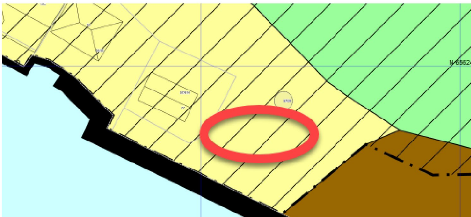
Figur 3 Utsnitt fra kommunedelplan, hvor plassering av avfallsstasjonene er vist med sirkel.