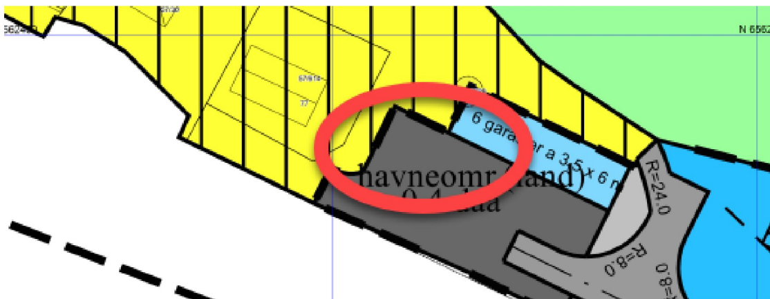
Figur 5 Tiltakets plassering i forhold til detaljreguleringsplaner.