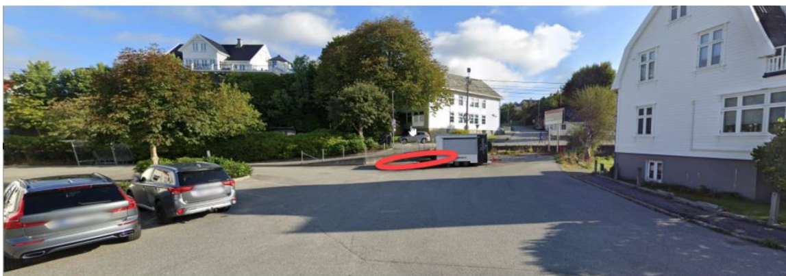
Figur 2 Plassering vist med utsnitt på gateplan fra Kaigata