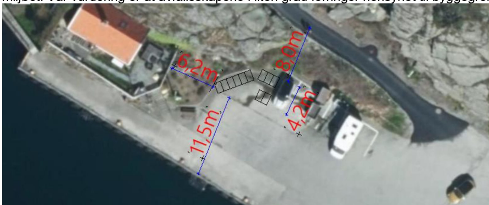
Figur 4 Utsnitt fra Norgebilder med skap-plassering illustrert.

Det har fra 01.01.23 kommet statlige krav om kildesortering som alle kommuner skal følge opp. Det innebærer at det må etableres anlegg som kan ta imot sortert avfall. Hensikten med kildesortering er å sikre en bærekraftig utvikling av samfunnet og redusere utslipp til natur og miljø. Plasseringen av skapene innenfor byggegrense mot sjø er å anse som et lite tiltak som totalt sett gir positiv virkning for miljøet. Vår vurdering er at avfallsskapene i liten grad forringer hensynet til byggegrensen.