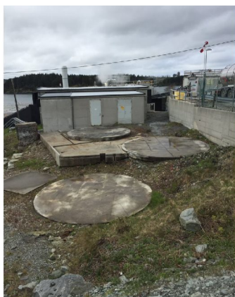
Bilde 4: fundamenter etter tre tidligere tanker, som kan ses i bilde 2.

Det er også slik at anlegget bruker røykgass fra kjelene og lut fra lagertank plassert i nærheten. I tillegg skal væsken sirkulere gjennom kolonnene og soda-lut-tankene. Dette tvang frem en plassering av soda-lut-anlegget nord på fabrikkområdet, med absorpsjonskolonner i umiddelbar nærhet. Høyden på absorpsjonskolonner er gitt av et høyde-diameterforhold basert på prosesssimuleringer for å kunne produsere den soda-lutfaktoren fabrikken trenger. Høyde over havet på anlegget ble i desember 2022 målt inn vha. 3D-skanning. Overkant av absorpsjonskolonne er 25,7 moh.