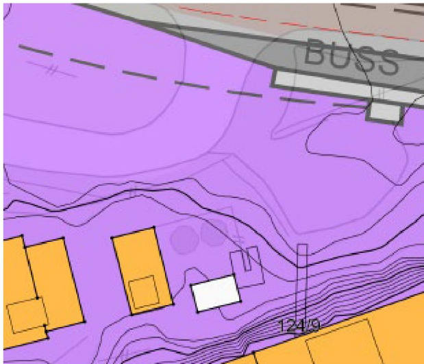
Bilde 5: utsnitt av reguleringskart. Stiplet linje indikerer byggegrensen for området.

Denne nordre delen av industriområdet ligger på en høyde, og omtrent alle tiltak i denne delen vil ha behov for dispensasjon fra reguleringsbestemmelsen om maks. kotehøyde. Tiltaket er omsøkt bygget på et opparbeidet område på kote 14, som ligger omtrent 3 meter ned fra vegnivå, og som ligger godt innenfor reguleringsområdets byggegrense.