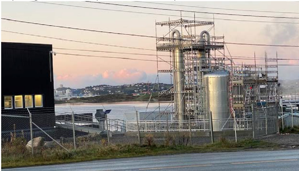
Avaldsnes kirken forsvinner i prosess tårnene

Høyder og utseende er tilsynelatende ikke så nøye.