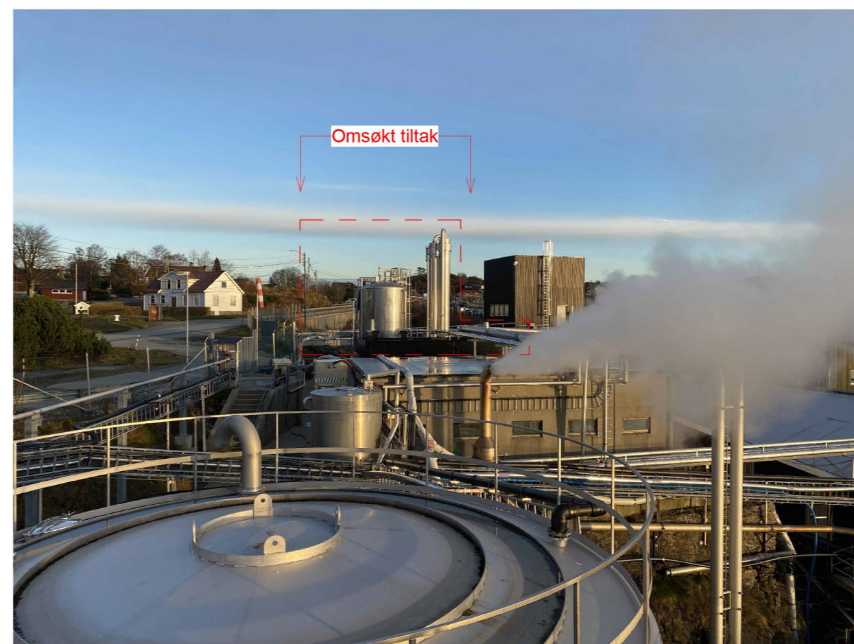
Anlegget sett fra nord