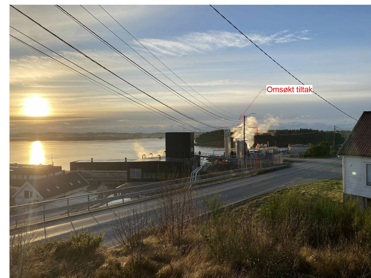
Anlegget sett fra sør-øst