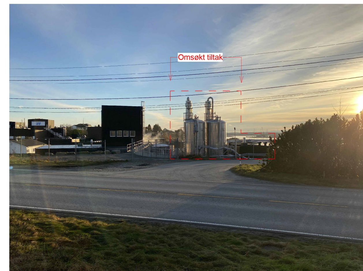
Anlegget sett fra nord-øst