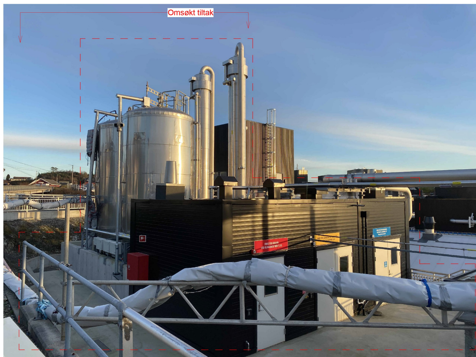
Anlegget sett fra nord-vest