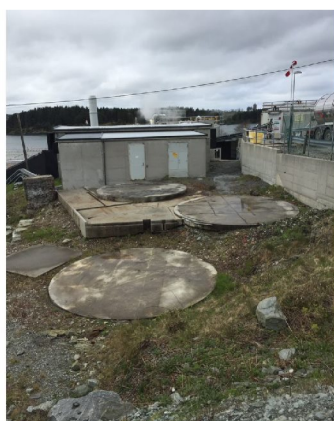
Bilde 4: fundamenter etter tre tidligere tanker, som kan ses i bilde 2.

Det er også slik at anlegget bruker røykgass fra kjelene og lut fra lagertank plassert i nærheten. I tillegg skal væsken sirkulere gjennom kolonnene og soda-lut-tankene. Dette tvang frem en plassering av soda-lut-anlegget nord på fabrikkområdet, med absorpsjonskolonner i umiddelbar nærhet. Høyden på absorpsjonskolonner er gitt av et høyde-diameterforhold basert på prosesssimuleringer for å kunne produsere den soda-lutfaktoren fabrikken trenger. Høyde over havet på anlegget ble i desember 2022 målt inn vha. 3D-skanning. Overkant av absorpsjonskolonne er 25,7 moh.