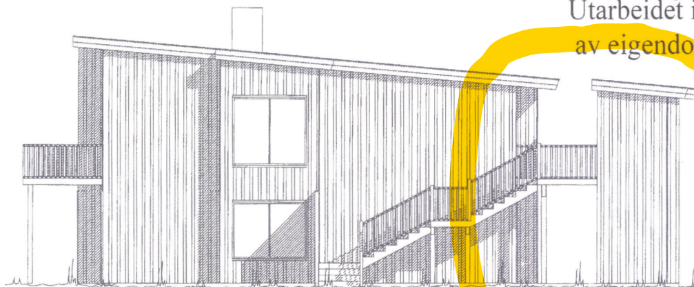
Fasade mot sør

Utarbeidet i forbindelse med begjering om seksjonering av eiendommen gnr 15 bnr2196 i 1149 Karmøy kommune.