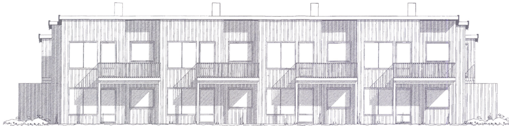
Fasade mot vest