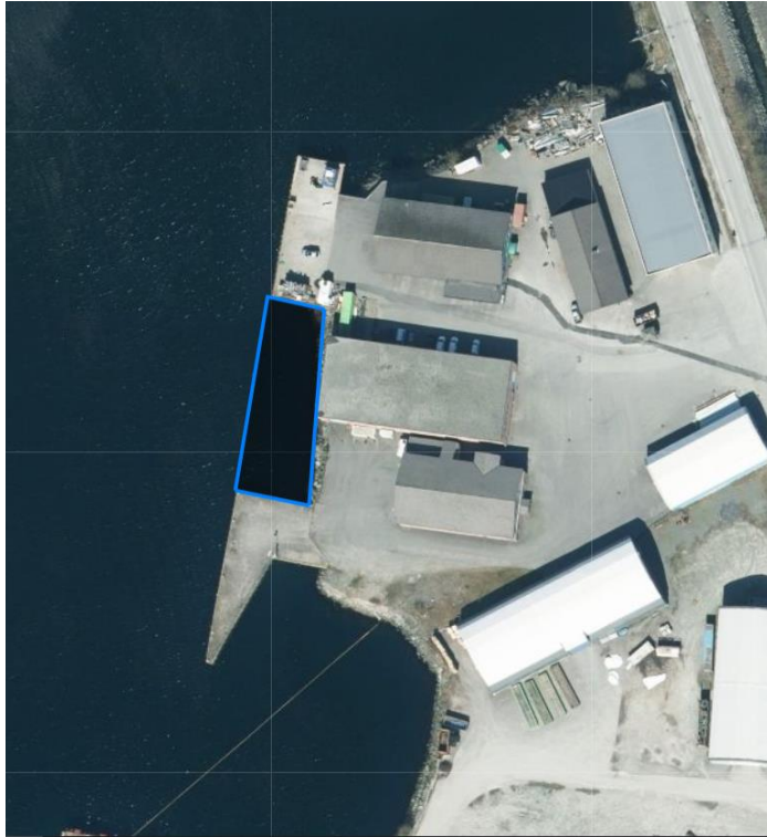
Foto fra 1964