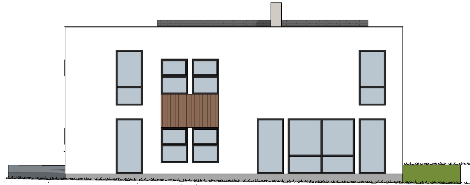
1:100 Fasade Vest