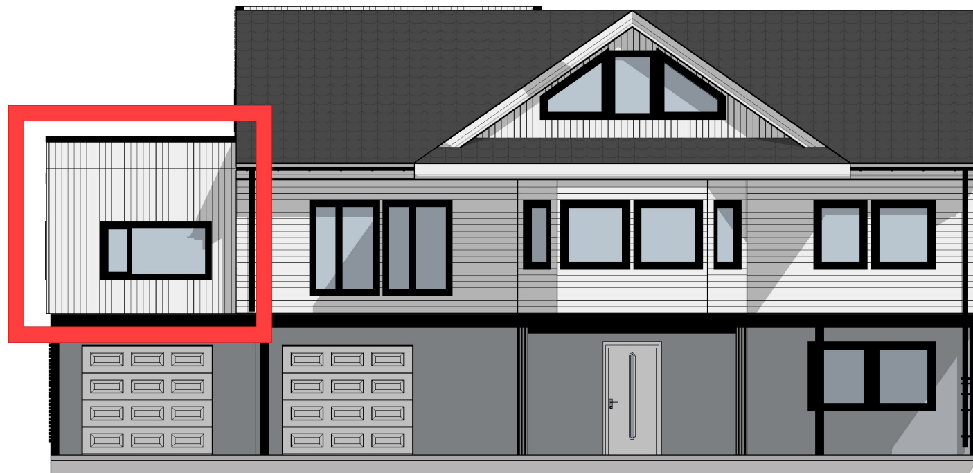
1:100 Fasade Nord