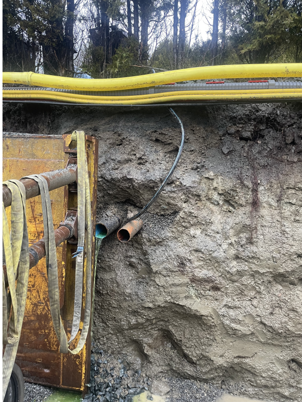
SI 0,00m Fra grøft mot hus