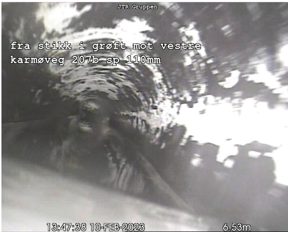
VN 6,50m Vannivå, Gradering 3