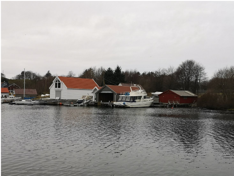
Naust og Brygge som Naboen har.

En Nabo fikk tillatelsen til å bygge et sjøhus og feste en betongbrygge i sjøen med betongblokker. Jeg fikk også tillatelsen til å bygge en naust med båtoppptrekk. Hva er forskjellen mellom tomter på høyre og venstre side ?