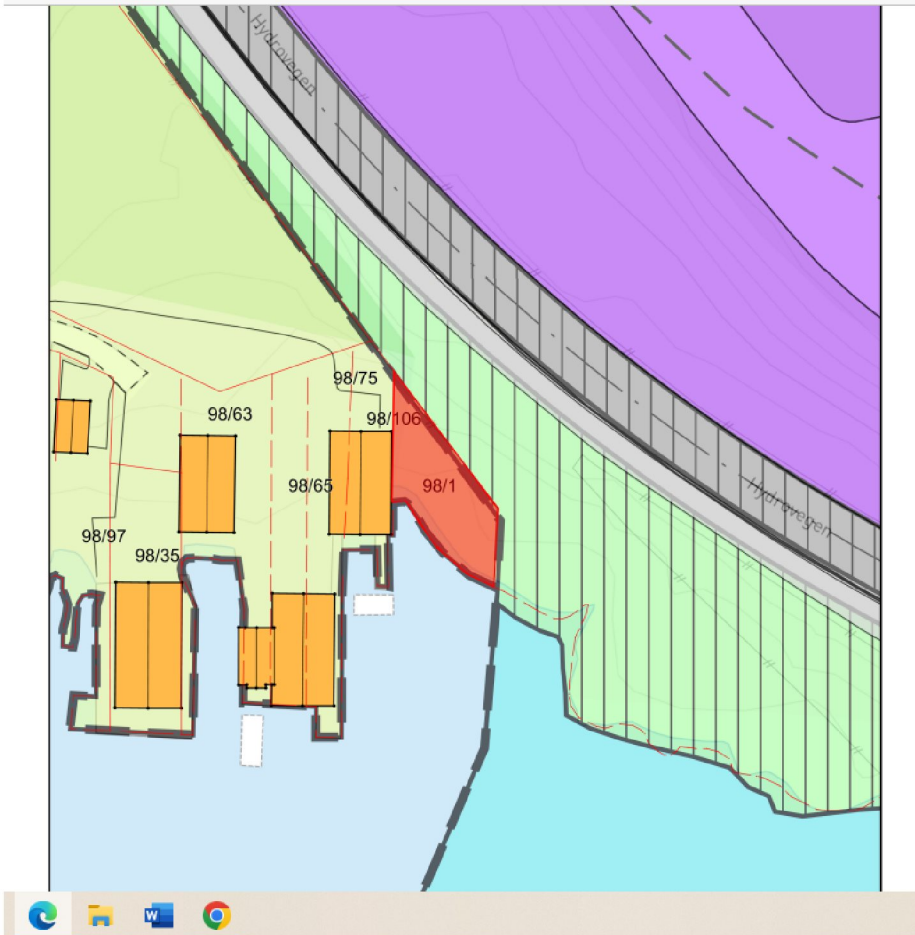
Det er en rekke med nausttomter, alle har samme grense til Hydro Aluminium.