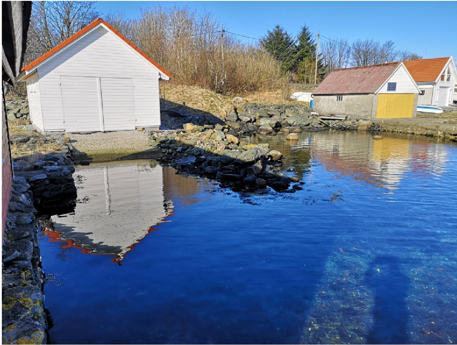
Naustet min min båtopptrekk.