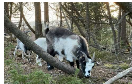
Noen av de som jobba i skogen