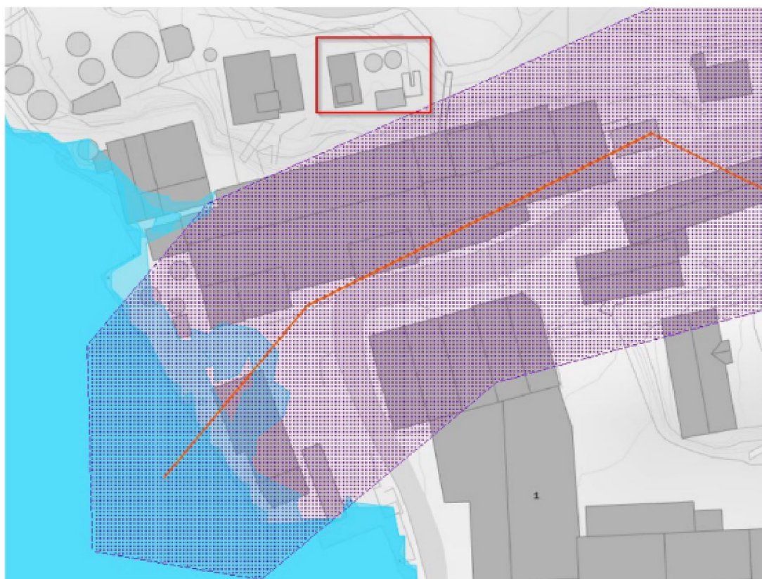
Figur 1: utklipp fra NVEs aktsomhetskart for flom (21.11.2022). Omsøkt tiltak innenfor rødt rektangel.

Tiltaket er plassert like nord for et område som er innenfor aktsomhetssonen for flom, jfr. figur 1 under.