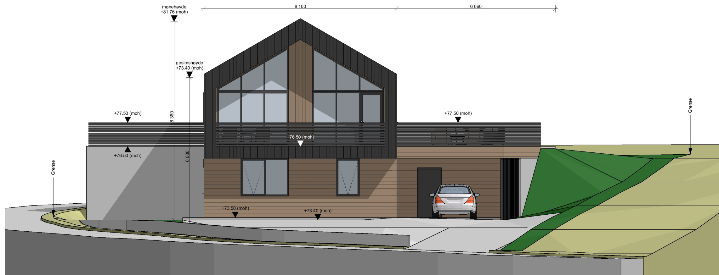
1:100 Fasade Nord