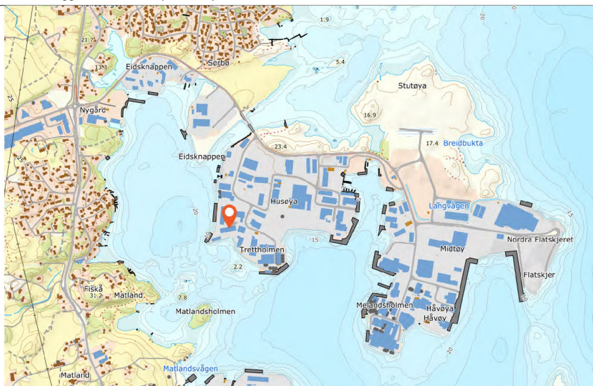
Kart 2: Omsøkt plassering av landstrømanlegget på Husøy.