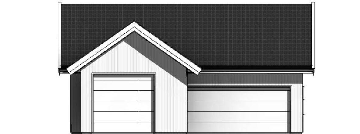
Vest 1 : 100