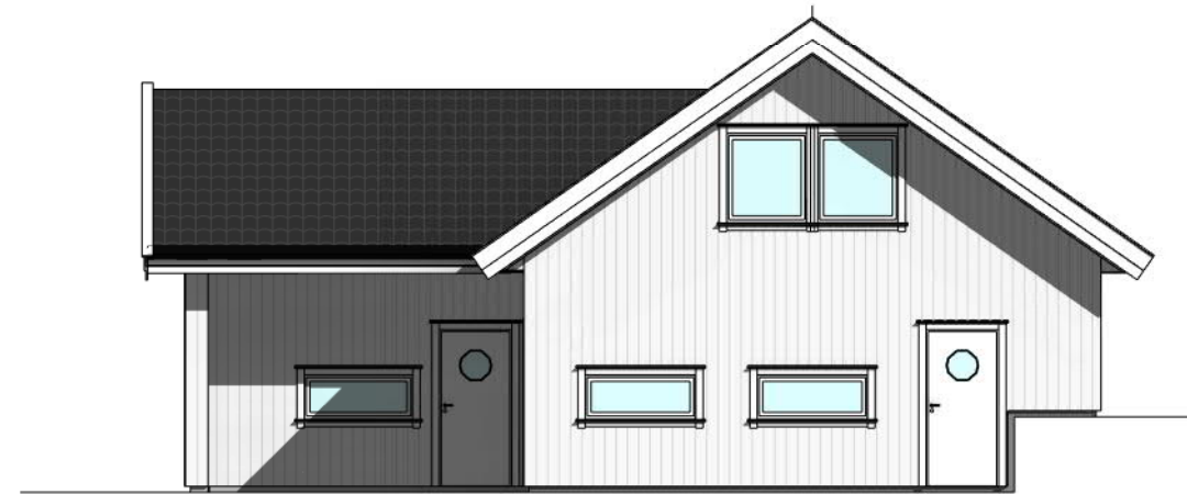
Sør 1 : 100