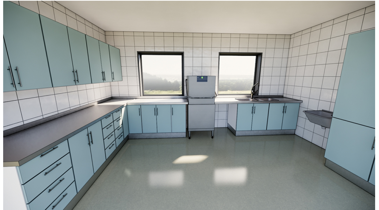
Illustrasjon kan avvike fra leverte produkter