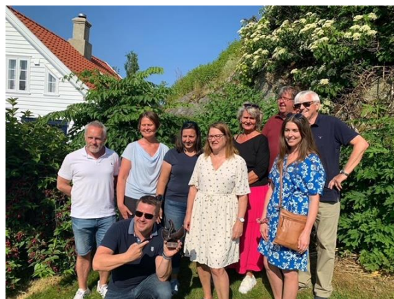
SILKstyret med hedersprisen Fiskaren.