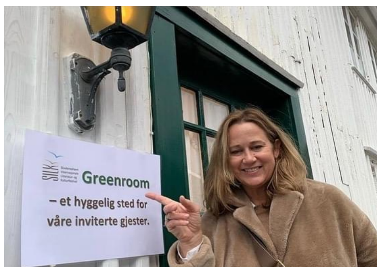
Green Room- hjertet i SILK.

Her har til og med avtaler mellom utenlandske forfattere og norske forlag blitt avtalt.