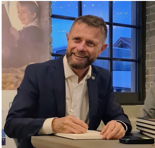
Boksignering hører med.