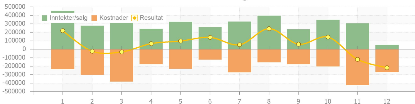
Figur for periode 1 - 12