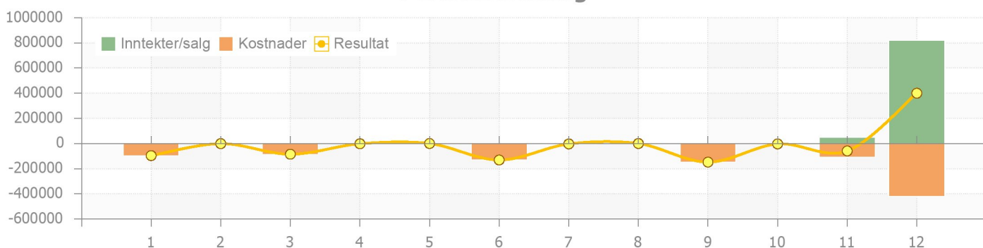
Figur for periode 1 - 12