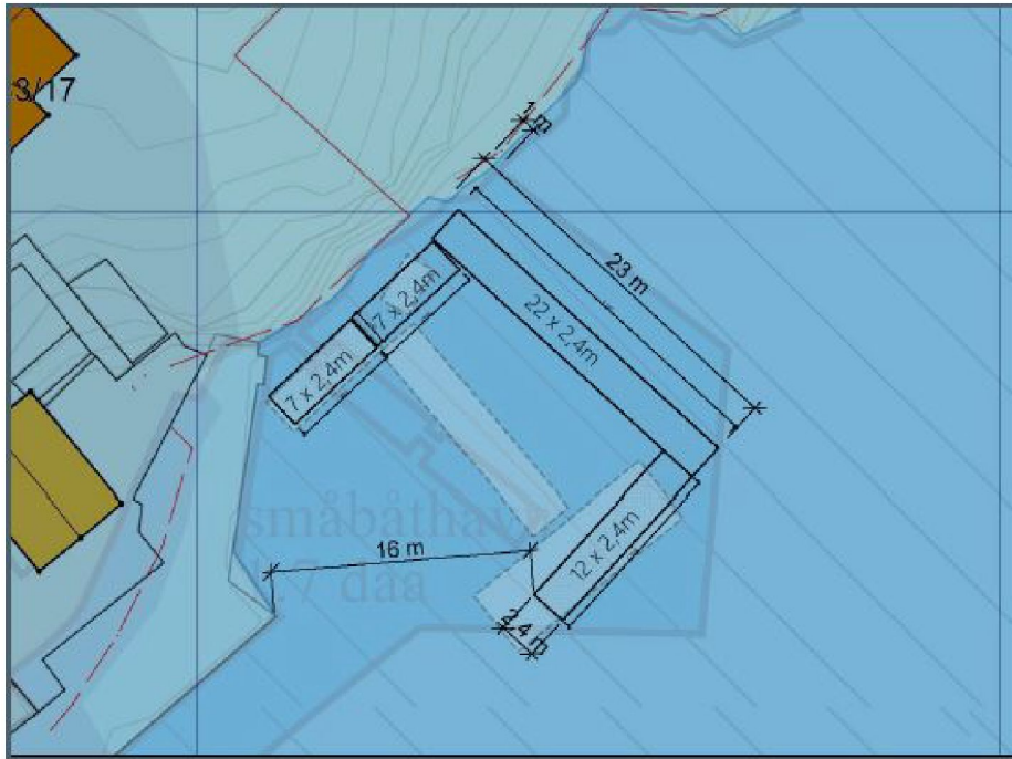
Omsøkt tiltak, dagens situasjon kan også sees