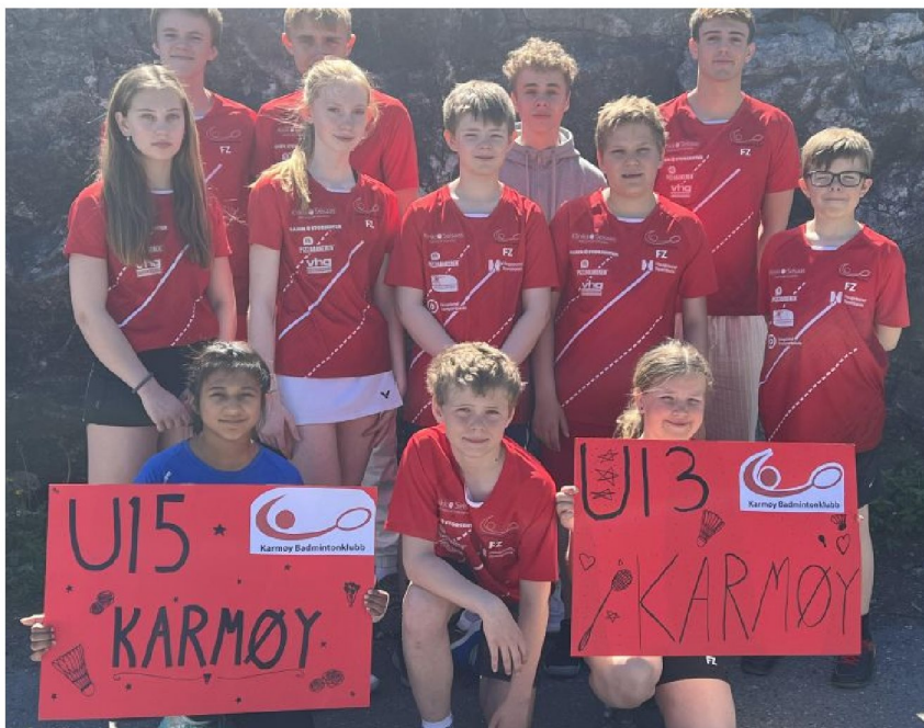
Bildet over viser gjengen som representerte Karmøy Badmintonklubb i landsfinalen for U13 og U15 i juni